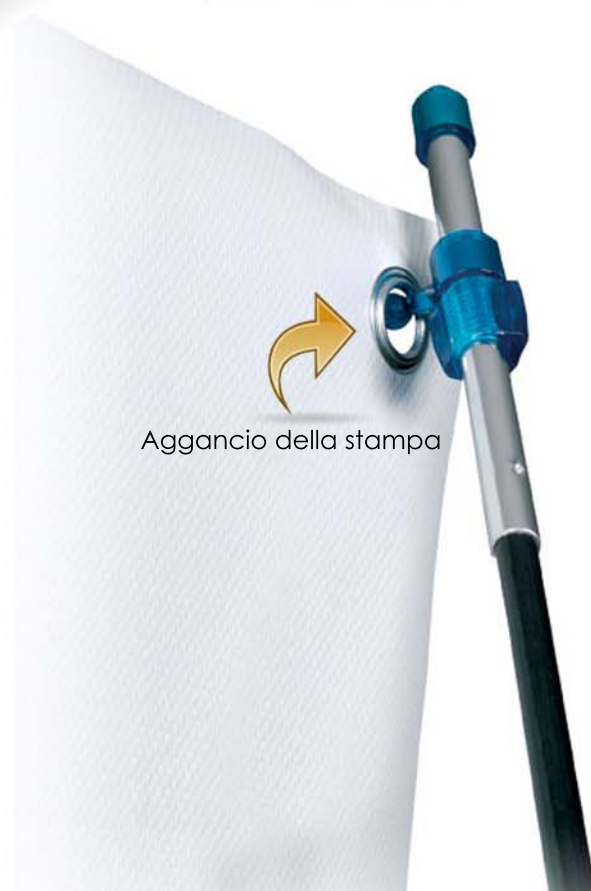
Aggancio della stampa